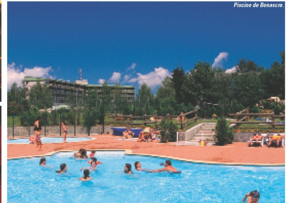
Piscine de Bonascre.