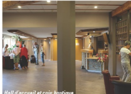
Hall d'accueil et coin boutique.