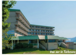
Vue sur le Tarbesou.