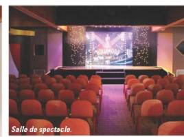
Salle de spectacle.