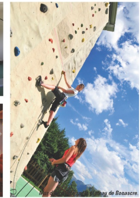
Piscine de Bonascre.