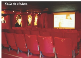
Salle de cinéma.