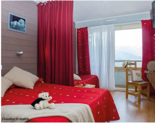
Chambre lit double.