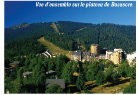
Vue d'ensemble sur le plateau de Bonascre.