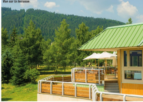
Vue sur la terrasse.