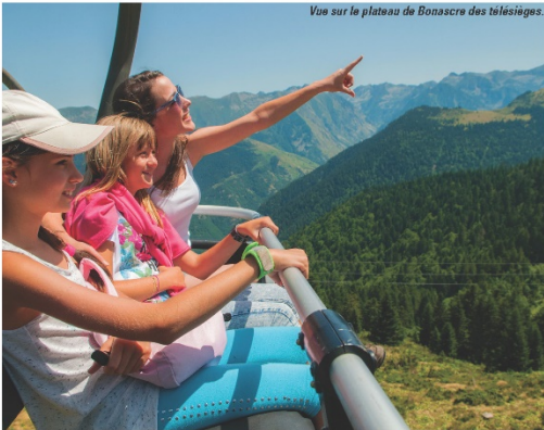
Vue sur le plateau de Bonascre des télésièges.