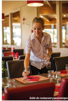
Salle de restaurant panoramique.