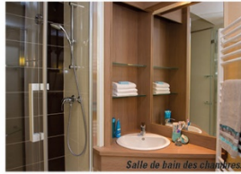
Salle de bain des chambres.