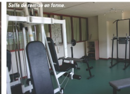
Salle de remise en forme.